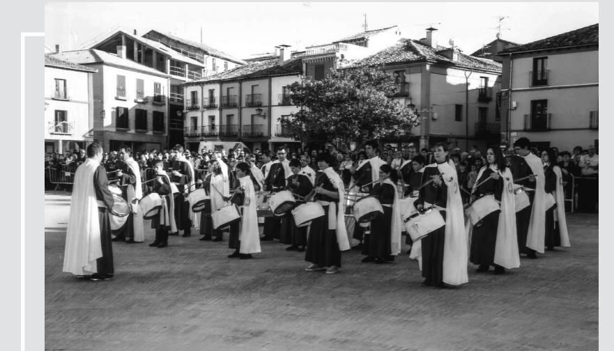
Banda de la Sta. Vera Cruz de Azagra (Navarra) en una Exaltación

El año pasado, los componentes de la Banda de Tambores. Cornetas y Bombos de la Vera Cruz, restringieron bastante sus actuaciones por causas de la pandemia del coronavirus. Una vez superada la epidemia, este año retornan a sus actividades tradicionales. Por de pronto realizarán dos salidas a certámenes y concentraciones: el 11 de marzo a Arnedo y el 1 de abril a Tudela, de Navarra. Se mantiene también el acompañamiento a la Vera Cruz de Medinaceli en su procesión de Jueves Santo. También han programado en Almazán la Rompida de la Hora, habitual hasta la enfermedad.