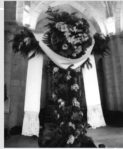
Cruz adornada de 2013