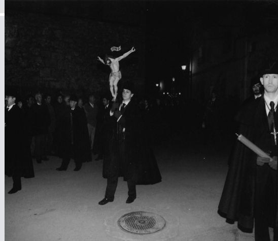
Santo Cristo de la Cofradía, desfilando en Viernes Santo, ya restaurado

En la Junta de Gobierno del 3 de mayo de 1944, se estableció que el crucifijo también podía acompañar a personas que no perteneciesen a la hermandad, previo pago de una limosna. Dice el acuerdo a la letra: “ Cuando se pida a la Venerable Cofradía de la Santa Vera Cruz que el Santo Cristo de la Hermandad acompañe